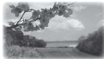
校舎から見る宍道湖